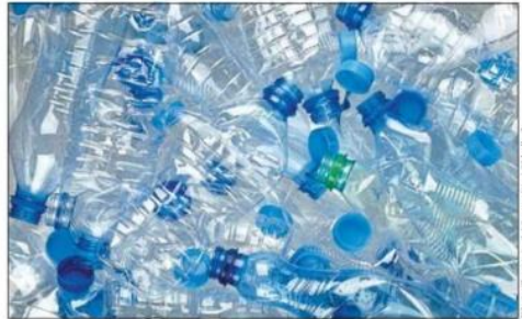
La consigne pour presque tous les contenants de boisson, en aluminium et en plastique, est de 10 cents.

À Saint-Jean-sur-Richelieu, deux points de dépôt Consignation sont disponibles, permettant des retours à l'unité ou des retours express via des sacs non triés. Il faut se présenter durant les heures d'ouverture (tous les jours de 8h à 18h, sauf les jeudis et vendredis, de 8h à 19h). Ces points de dépôt sont situés au 290, boulevard Saint-Luc, local 28 et au 1005,