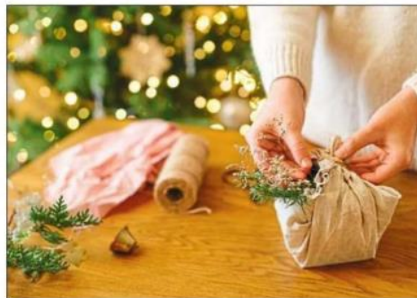
Pour des cadeaux écologiques, essayez le furoshiki , une technique japonaise d'emballage en tissu.

Si la vaisselle réutilisable n'est pas une option, optez pour des assiettes en carton ou en bambou et des couverts en bois qui iront dans le bac brun après utilisation. Ces solutions permettent de limiter l'usage de plastique et d'avoir un impact moindre sur l'environnement. Vous pouvez également envisager d'emprunter de la vaisselle auprès de proches ou